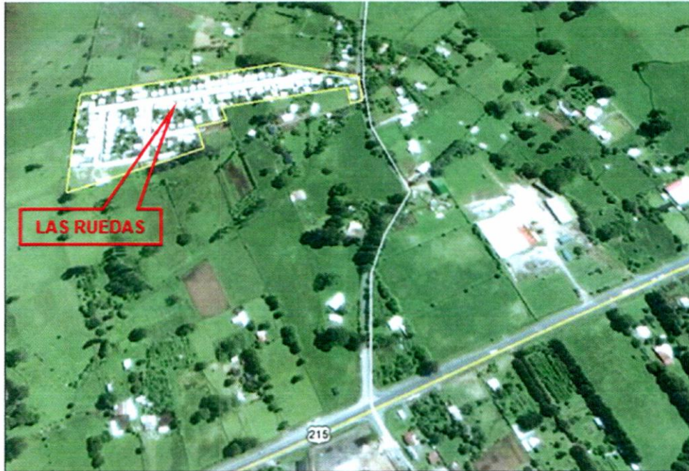
Emplazamiento Sector Las Ruedas