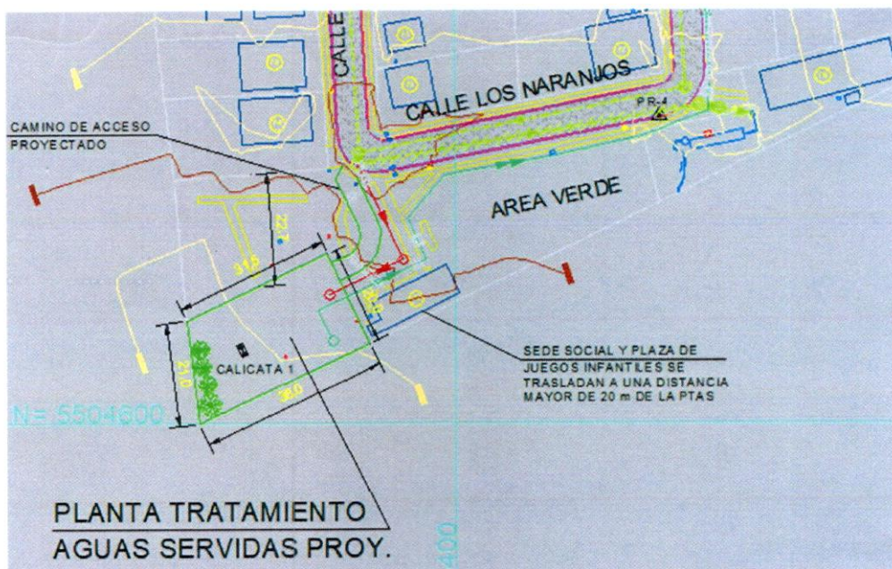
Emplazamiento PTAS Las Ruedas

Dicho proyecto está en etapa de Postulación de Fondos para su construcción, ante la SUBDERE. De acuerdo a una de las observaciones de dicha institución, se requiere la aprobación de la Dirección de Obras Hidráulicas, específicamente del Servicio Sanitarios Rurales, SSR. Por lo el proyecto fue presentado a éste último, durante Julio del 2025, para aprobación técnica.