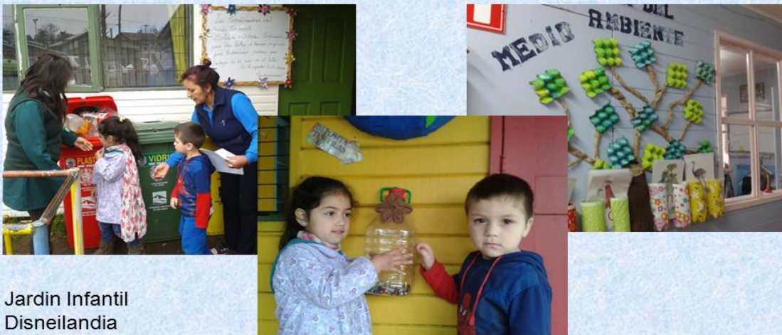
Jardin Infantil Disneilandia

Trabajo con instituciones. Debe tenerse presente que cuando se habla de gestión de residuos, el primer objetivo es evitar la generación; si esta no es posible de evitar, se debe procurar su minimización; si esto no es posible, entonces se debe recién evaluar su potencial disposición final. En este aspecto la educación ambiental es primordial.