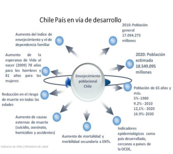
Esperanza de vida al nacer en años, por región y sexo, Chile