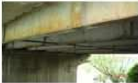
Vista de la superestructura del Puente San Pedro, compuesta por vigas metálicas y losa de hormigón.