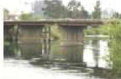
Puente San Pedro, vista desde la ribera sur - oriente, se observa la infraestructura del puente compuesta por 8 tramos, apoyados en torres de hormigón.